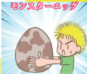
モンスターエッグ