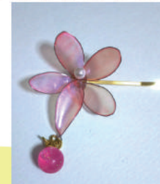
ディップフラワー