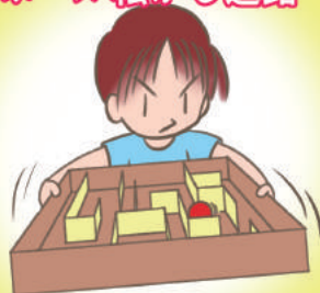
ボール転がし迷路