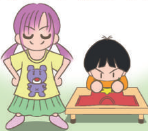
オリジナル柄Tシャツ